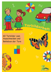
405-60304 TORBILDER 60 Torbilder zum Ausschneiden und Bekleben der Kartontore