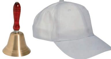
224-23300 ZALLALLA GLOCKE 151-02302 HAUSMEISTERMÜTZE Ausstattung für das Hausmeisterteam