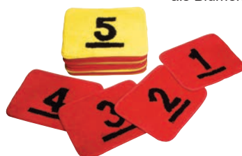
207-20300 ZAHLENWEG - Set 1-20 20 Teppichfliesen für die Zahlen 1-20 mit rutschfester Gummierung