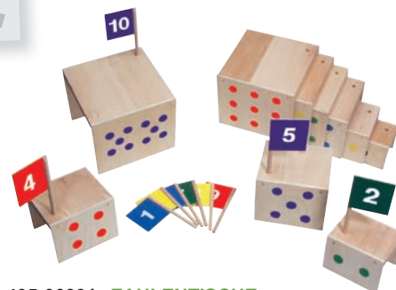
405-06301 ZAHLENTISCHE 10 Tische mit aufgedruckten Zahlenpunkten und dazugehörigen Fähnchen