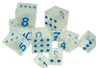
207-20002 GEWICHTSWÜRFEL 10 Gewichtswürfel, die mit Artikel 426-06 Glasgewicht befüllt werden können