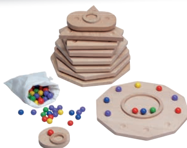
207-20001 ZAHLENGÄRTEN 10 geometrische Gärten mit farbigen Holzperlen als Blumen