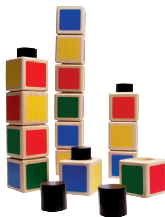
351-12300 ZAHLENTÜRME 40 Turmwürfel mit Verbindungssteckern zum stabilen Aufbau