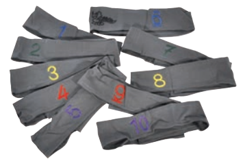
405-19000 STIRNBÄNDER 10 Kopfbänder mit aufgenähten Ziffern und Klettverschluss