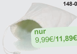
148-07000 GLASGEWICHT - 1 kg 3 Kilogramm des Glasgewichtes werden benötigt, um die Gewichtswürfel zu befüllen.

Diese Zusatzprodukte könnten für Sie sehr interessant sein.