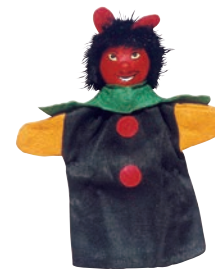
411-10027 ZALLALLA FEHLERTEUFEL GROSS Der Fehlerteufel ist ein wichtiger und fester Bestandteil des Konzepts „Entdeckungen im Zahlenland“. Größe von Kopf bis Fuß 30 cm.