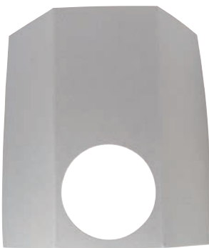
405-06304 KARTONTOR Die 10 Kartontore werden mit den 405-60304 Torbildern beklebt.