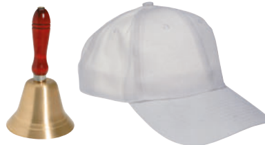
426-07 ZALLALLA GLOCKE 193-52 HAUSMEISTERMÜTZE Ausstattung für das Hausmeisterteam