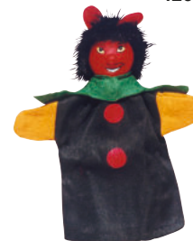
321-27 ZALLALLA FEHLERTEUFEL GROSS Der Fehlerteufel ist ein wichtiger und fester Bestandteil des Konzepts „Entdeckungen im Zahlenland“. Größe von Kopf bis Fuß 30 cm.