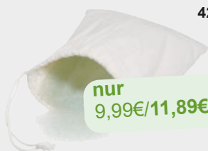
426-06 GLASGEWICHT - 1 kg 3 Kilogramm des Glasgewichtes werden benötigt, um die Gewichtswürfel zu befüllen.

Diese Zusatzprodukte könnten für Sie sehr interessant sein.