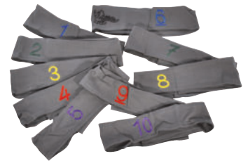
426-20 STIRNBÄNDER 10 Kopfbänder mit aufgenähten Ziffern und Klettverschluss