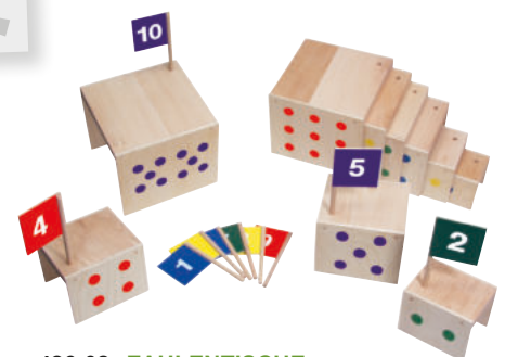
426-02 ZAHLENTISCHE 10 Tische mit aufgedruckten Zahlenpunkten und dazugehörigen Fähnchen