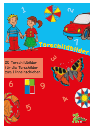
426-13 TORSCHILDBILDER 20 Torschildbilder zum Bestücken des Torschilds