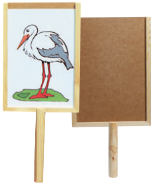
426-08 TORSCHILD Das Torschild des Torwächters wird mit Artikel 426-13 beidseitig bestückt.