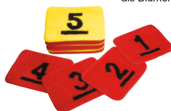
426-41 ZAHLENWEG - Set 1-20 20 Teppichfliesen für die Zahlen 1-20 mit rutschfester Gummierung