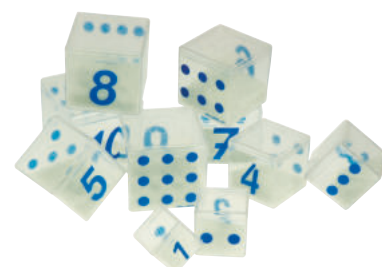
426-04 GEWICHTSWÜRFEL 10 Gewichtswürfel, die mit Artikel 426-06 Glasgewicht befüllt werden können