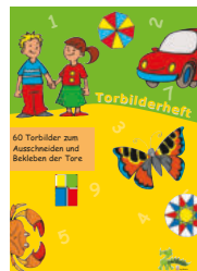
426-14 TORBILDER 60 Torbilder zum Ausschneiden und Bekleben der Kartontore