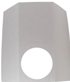
426-15 KARTONTOR Die 10 Kartontore werden mit den 426-14 Torbildern beklebt.