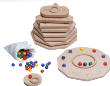
426-03 ZAHLENGÄRTEN 10 geometrische Gärten mit farbigen Holzperlen als Blumen