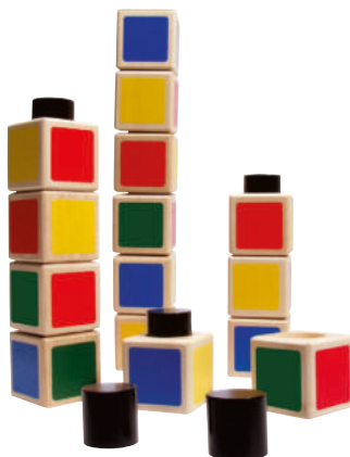
426-01 ZAHLENTÜRME 40 Turmwürfel mit Verbindungssteckern zum stabilen Aufbau

Bei Bestellungen mit den Holzboxen werden insgesamt 4 Kartons geliefert.